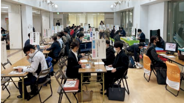
キャリア・ザ・ライブの様子