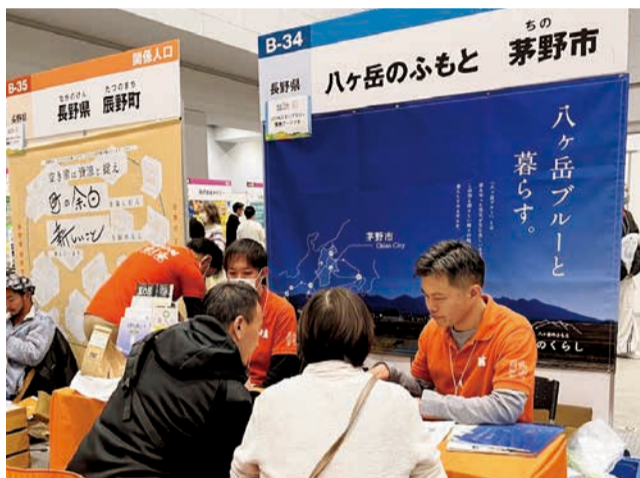
茅野市出展ブースの様子

茅野市のブースでは、夏の暑さや冬の積雪量などの気候についての質問や物件情報、移住後の就職についての相談が多く寄せられた。また八ヶ岳などの自然豊かな景色が魅力で茅野市を知ったという声もあった。楽園信州ちの協議会は今年後も移住促進イベントに参加し、茅野市への移住を推進していく。