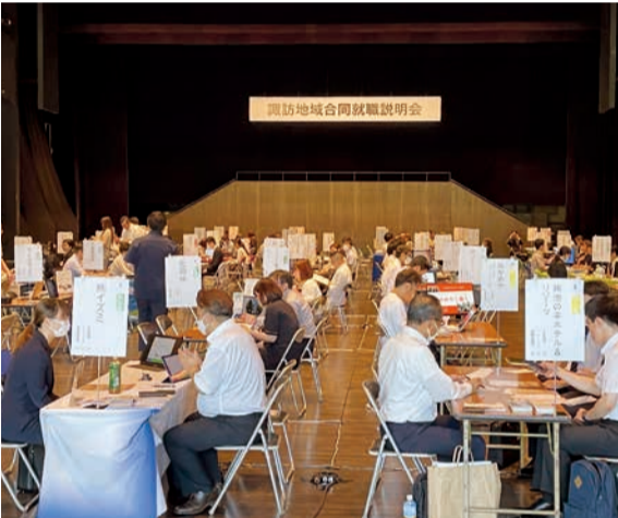
合同就職説明会の様子

諏訪地域労務対策協議会は、8月10日、茅野市民館にて合同就職説明会を開催した。本説明会は、2025年度新卒予定者や経験者等105名が来場に向けた就職説明会であった。