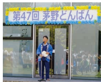
祭典委員長の挨拶