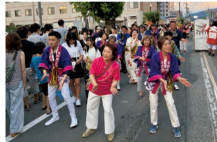
茅野商工会議所踊り連