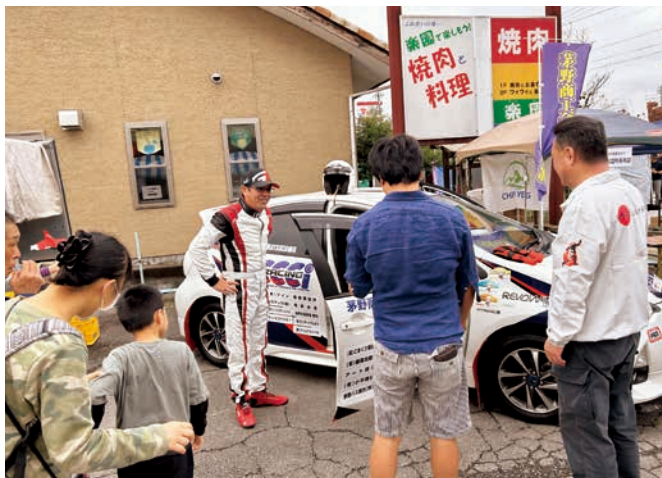
ラリーカーの試乗体験