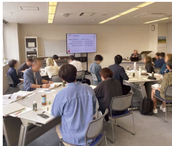
創業スクールの様子