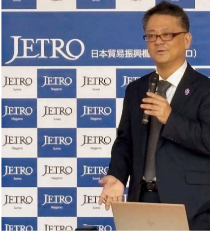
ジェトロ上海事務所長の天野真也氏

24名が出席し、市理事者政策監他全12名と意見交換を行った。この懇談会開催にあたり、9月中旬に建設産業関連の団体からの要望を当委員会が取りまとめ、市へ提出事前に回答書ももらっていたが、当日改めて回答の説明があった。