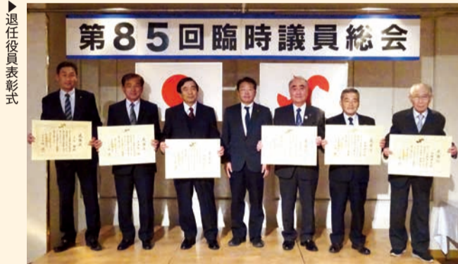
臨時議員総会終了後、同会場にて退任される役員の皆様へ感謝状が贈られた。