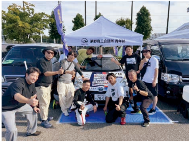
無事完走できました!

こんにくパークでは、工場見学を通じて製造工程を間近で見学し、試食コーナーや売店の運営など、来場者を楽しませる工夫を体感した。顧客対応力の高さや店舗の雰囲気づくりなど、学ぶことが多く、参加した女性会員からは「お客様を迎える仕組みが整っており、消費者目線ですべて満足度が高いです。本日も学んだことを参考に、自社にも取り込んでいきたいです」と話していた。今回の視察研修は、経済人としての教養を深めるとともに、地域企業の運営や接客のあり方を学ぶ貴重な機会となった。参加者同士の交流も深まり、有意義な一日となった。