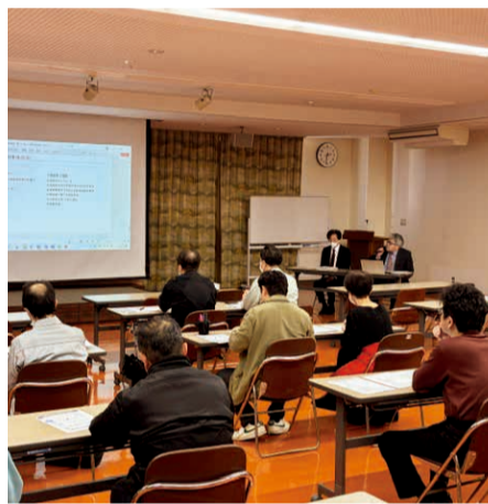
省工ネ補助金説明会の様子

当所(茅野中小企業相談所)は、環境共創イニシアチブ(国)から事務局委託、長野県中小企業GX推進事務局(長野県)から事務局委託、長野県産業労働部経営・創業支援課と共催で、令和8年度に活用できる、国&県の省工ネ関連補助金の説明会を4月3日(金)に開催した。