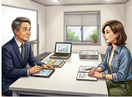
相談会のイメージ

当所は、物価高騰や賃金引上げ、人手不足といった急速な事業環境の変化に直面する会員事業者等を支援するため、専門家による3つの個別相談会を順次開催している。