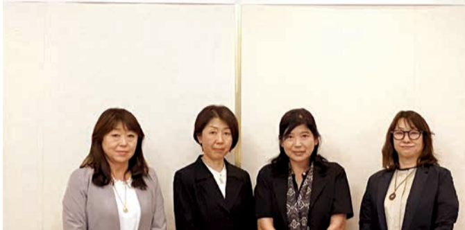
令和8年度 正副会長