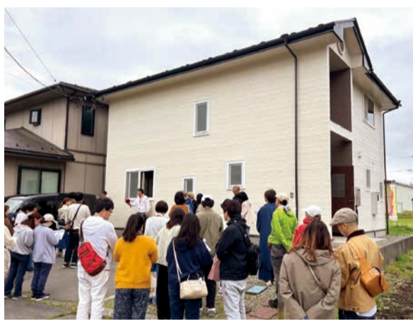
物件の説明を聞くツアー参加者

「補助金制度説明・個別相談会」では中小企業診断士が小規模事業者持続化補助金をはじめとする各種補助金の制度説明や申請書へのアドバイスを行っている。また「デジタル化・IT活用個別相談会」ではITアドバイザーを招き、売上アップや業務効率化に繋がるSNS活用やITツールの選定をマンツーマンで指導。今年度から新たに始めた「賃上げ・人手不足対応個別相談会」では、社会保険労務士が業務改善助成金の活用や労務環境の整備について助成金受給の事例を交えながら具体的な活用策をアドバイスしている。